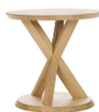
VOLKSHAUS SIDE TABLE 2024