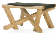
VOLKSHAUS STOOL 2024