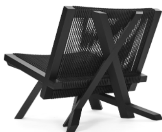
VOLKSHAUS LOUNGE CHAIR Natur natural