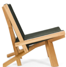
VOLKSHAUS LOUNGE CHAIR 2024