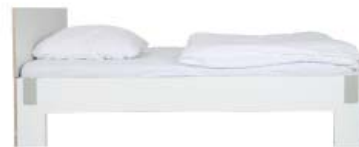
mit Kopfteil/with headboard