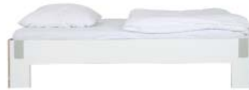
ohne Kopfteil/without headboard

height between mattress support and upper edge bed: 8,7 - 16,6 cm