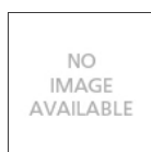
DRIVER 25W 24V DC T409996