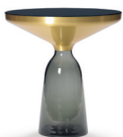
BELL SIDE TABLE 2012