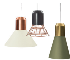
BELL LIGHT PENDANT LAMP 2013