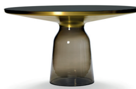
BELL HIGH TABLE 2020