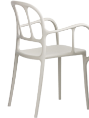
Matt colour Beige 1733 C