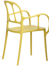
Matt colour Yellow 1666 C