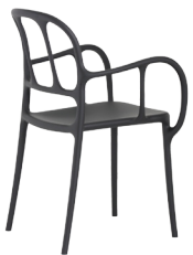
Matt colour Black 1769 C