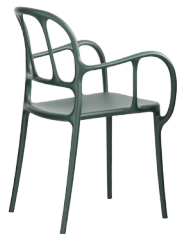
Matt colour Dark Green 1556 C