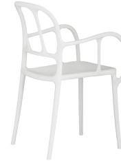
Matt colour White 1738 C