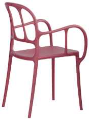
Matt colour Red 1484 C