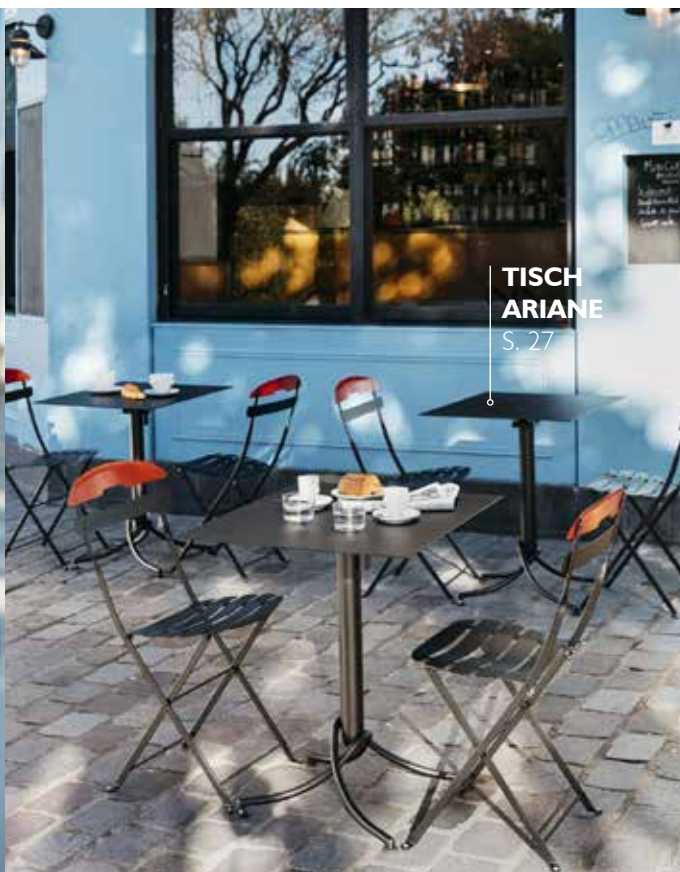
TISCH ARIANE S. 27