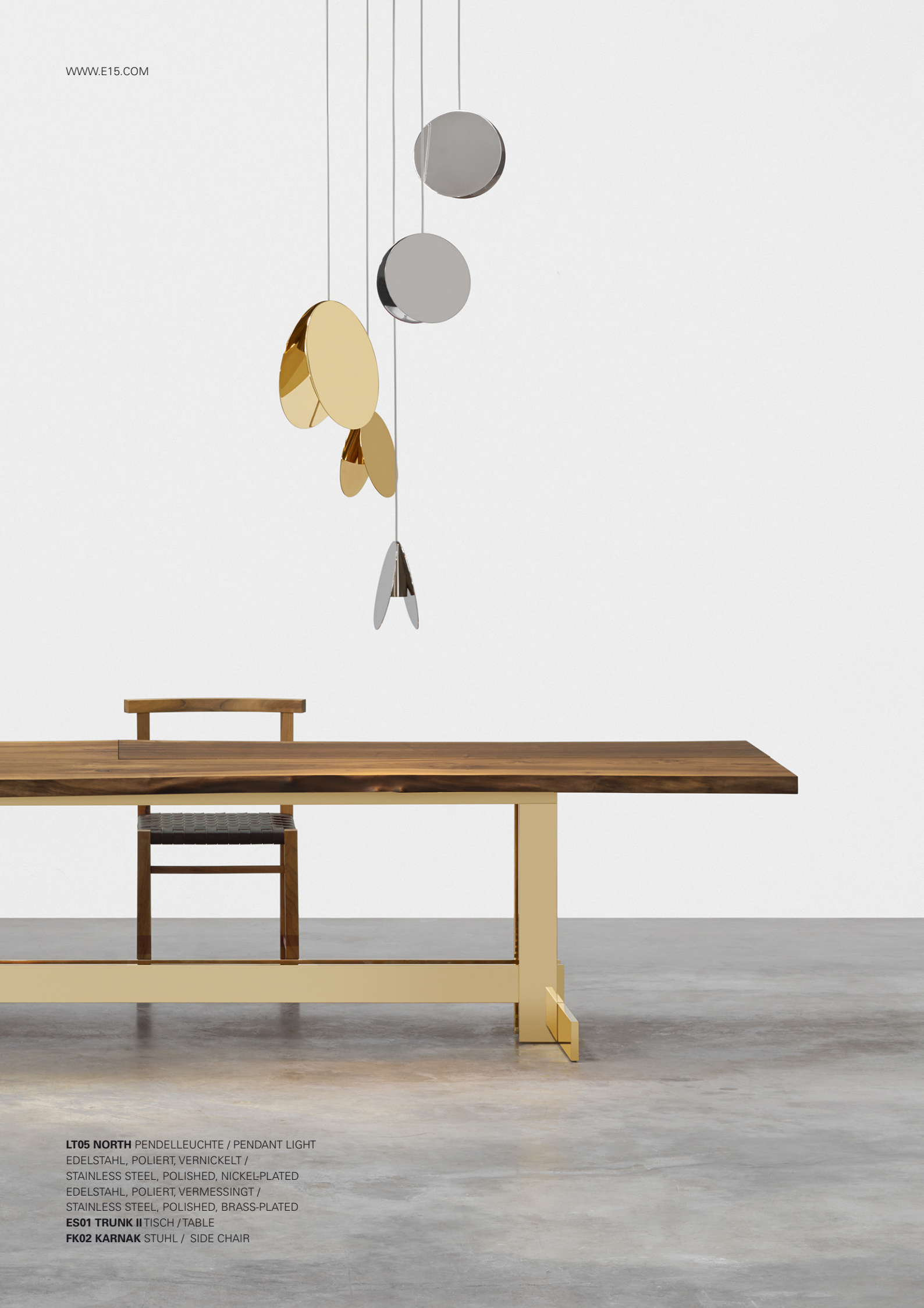
LT05 NORTH PENDELLEUCHE / PENDANT LIGHT EDELSTAHL, POLIERT, VERNICKELT / STAINLESS STEEL, POLISHED, NICKEL-PLATED EDELSTAHL, POLIERT, VERMESSINGT / STAINLESS STEEL, POLISHED, BRASS-PLATED ES01 TRUNK II TISCH / TABLE FK02 KARNAK STUHL / SIDE CHAIR