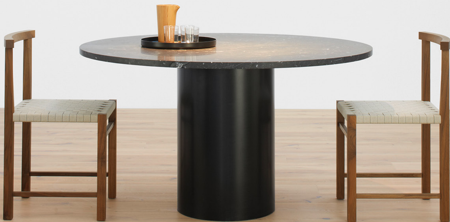
LT05 NORTH PENDELLEUCHE / PENDANT LIGHT STAHL, SIGNALWEISS PULVERBESCHICHTET / STEEL, SIGNAL WHITE POWDER-COATED STAHL, SCHWEFELGELB PULVERBESCHICHTET / STEEL, SULFUR YELLOW POWDER-COATED TA20 HIROKI TISCH / TABLE CM05 HABIBI TABLETT / TRAY FK02 KARNAK STUHL / SIDE CHAIR