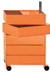
Glossy colour Orange 1658 C