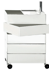
Glossy colour White 1673 C