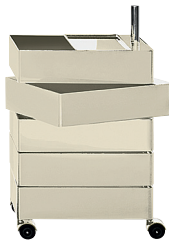
Glossy colour Light Grey 1707 C