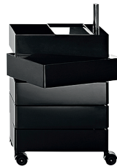
Glossy colour Black 1764 C