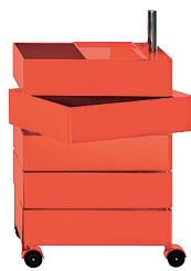
Glossy colour Red 1120 C