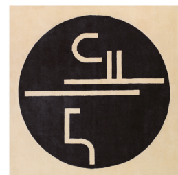
ST. TROPEZ 1926 - 1935