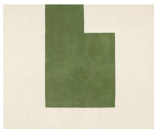
KILKENNY 1926 - 1935