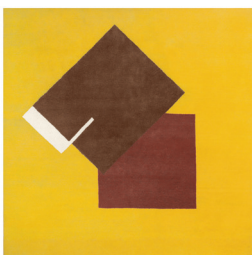
CASTELLAR 1926 - 1935