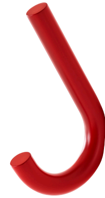
S 12 STAHLROHR PULVERBESCHICHTET TOMATENROT RAL 3013 TUBULAR STEEL POWDER-COATED TOMATO RED RAL 3013