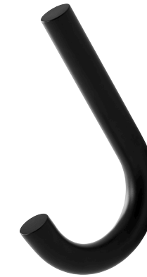
S 12 STAHLROHR PULVERBESCHICHTET TIEFSCHWARZ RAL 9005 TUBULAR STEEL POWDER-COATED DEEP BLACK RAL 9005