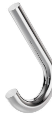
S 12 STAHLROHR VERCHROMT TUBULAR STEEL CHROME PLATED