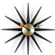
Sunburst Clock, schwarz/Messing, Ø 470