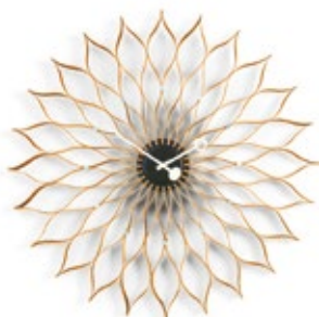
Sunflower Clock, Birke, Ø 750