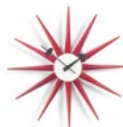
Sunburst Clock, rot, Ø 470