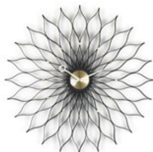
Sunflower Clock, Esche schwarz/Messing, Ø 750