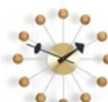
Ball Clock, Kirschbaum, Ø 330