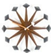
Polygon Clock, Nussbaum, Ø 430