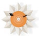
Diamond Markers Clock, weiss, Ø 335