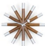
Wheel Clock, Nussbaum/Aluminium, Ø 455