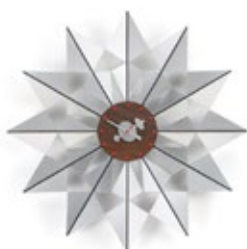
Flock of Butterflies, Aluminium, Ø 610