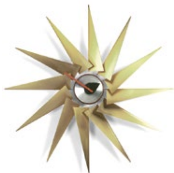
Turbine Clock, Messing/Aluminium, Ø 765