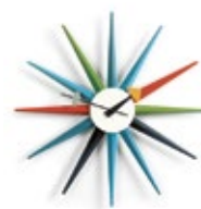
Sunburst Clock, mehrfarbig, Ø 470